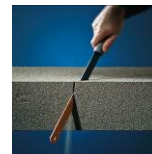
Leicht zu bearbeiten